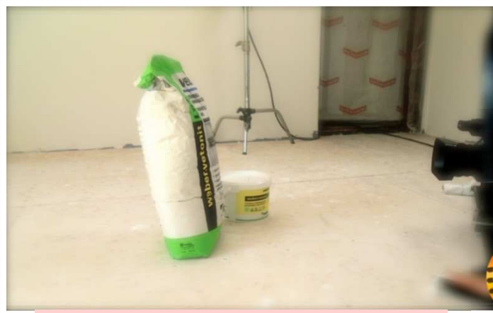
ТВ – РОЛИК В ПРОГРАММЕ «ЧИСТАЯ РАБОТА» НА РЕН-ТВ